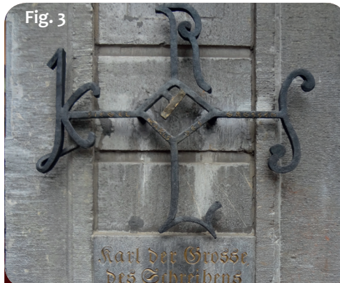
Sur le monogramme de Charlemagne apparaissent toutes les lettres de son nom, KAROLUS.

Si on demande aux gens à quoi ils pensent quand on leur parle de Charlemagne, la plupart diront qu'il s'agissait d'un homme grand et puissant avec une barbe et une couronne. Généralement, «Aix-la-Chapelle» et «Père de l'Europe» sont également cités comme mots-clés. C'est tout de même étonnant qu'un homme mort depuis environ 1 200 ans (en 814) soit aussi connu. Est-ce que tout ce qu'on raconte sur lui est vrai ? D'ailleurs, d'où sait-on tout ça ?