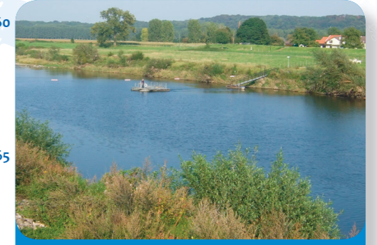
Abb. 4: „Grensmaas“, auch wenn man es nicht sieht: auf der einen Seite Belgien, auf der anderen die Niederlande.

MITTEL UND WEGE MOYENS ET MANIERES MIDDELEN EN WEGEN