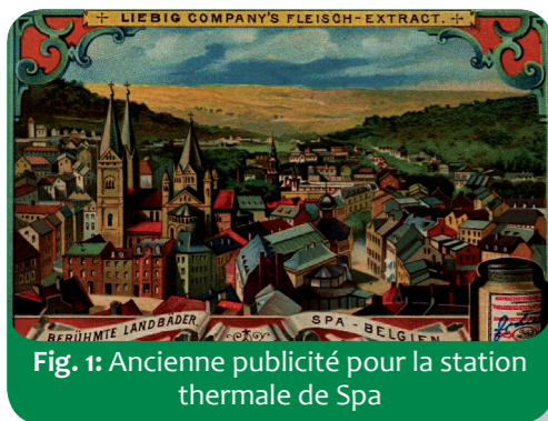
Fig. 1: Ancienne publicité pour la station thermique de Spa

Ça en vaut donc doublement la peine ! Et pas qu'à Aix-la-Chapelle. Aujourd'hui, beaucoup de personnes se rendent aussi