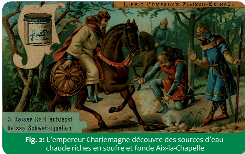
Fig. 2: L'empereur Charlemagne découvre des sources d'eau chaude riches en soufre et fonde Aix-la-Chapelle

Dans l'Euregio, les sources jouent un rôle particulier. À Burtscheid , un quartier d'Aix-la-Chapelle, on trouve les sources les plus chaudes de toute l'Europe - leur eau est à plus de 70°C !