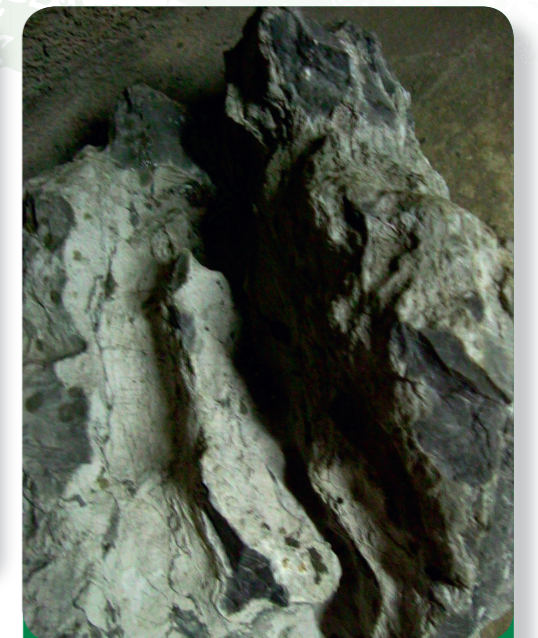
Fig. 5: «Canalisations» formées par le calcaire - c'est par ces fissures que l'eau chaude remontait à la surface.

Même le nom allemand d'«Aix-la-Chapelle», Aachen, fait référence à l'eau ; il vient du nom germanique «Aha». L'appellation latine d'Aix-la-Chapelle, « Aquae Granni » (= eaux de Grannus) est utilisée depuis le Moyen Âge et fait référence au dieu gaulois guérisseur vénéré par les Romains, «Grannus».